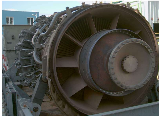
Vista frontale della turbina

A seguito di una ispezione termografica preventiva ad una fermata programmata è stato evidenziato un andamento di temperatura anomalo sul giunto flessibile, che convoglia i gas dalla turbina alla caldaia.