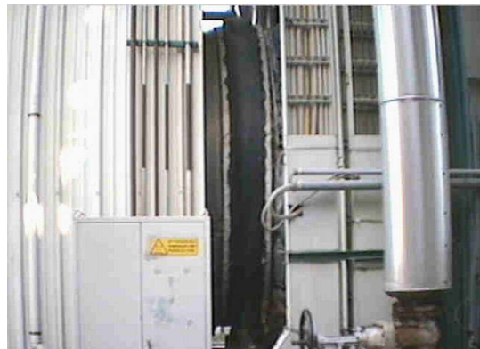
Vista laterale del giunto