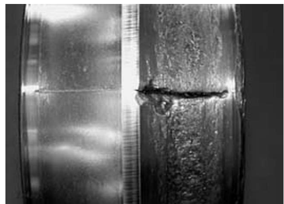
Particolare del cuscinetto danneggiato