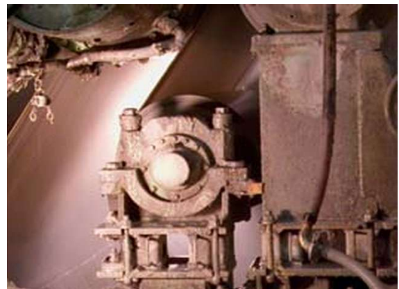
Rullo tendi tela

Il cliente ha rilevato la presenza di elevate vibrazioni in prossimità del cilindro tela